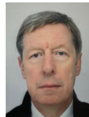
Site Web Henri PANEK